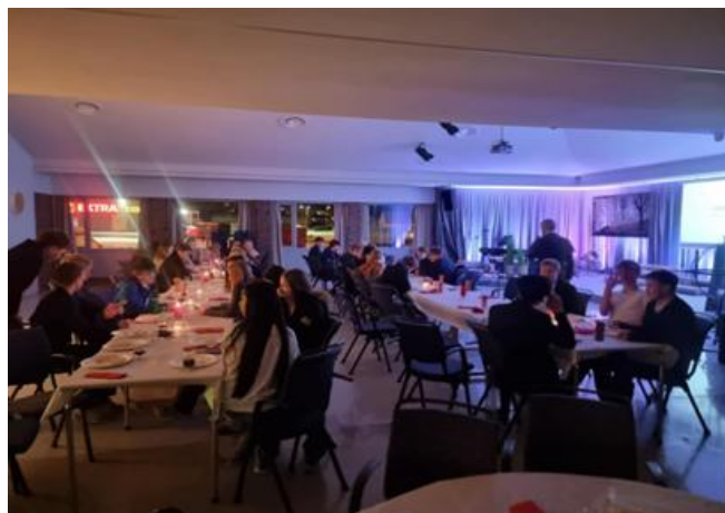
Fra ungdommens julebord